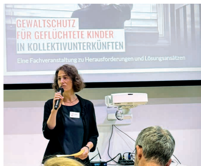
Lors de notre séminaire, des spécialistes ont partagé les stratégies efficaces pour protéger les enfants réfugié.e.s contre la violence et ont identifié les lacunes qui subsistent.

Avec ces instruments, nous poursuivons un objectif clair: renforcer les structures, prévenir la violence et intégrer systématiquement l'intérêt supérieur de l'enfant dans le quotidien des centres d'hébergement.