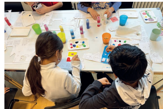
Notre équipe vous conseille sur de nombreux sujets, notamment l'organisation d'activités adaptées aux enfants.

Nous voulons plus qu'un soutien ponctuel; notre travail doit permettre de modifier les structures. Hébergements et modalités de visite doivent d'emblée répondre aux besoins des enfants. Il faut écouter, protéger et soutenir les enfants – sans distinction d'origine, statut ou conditions de vie.