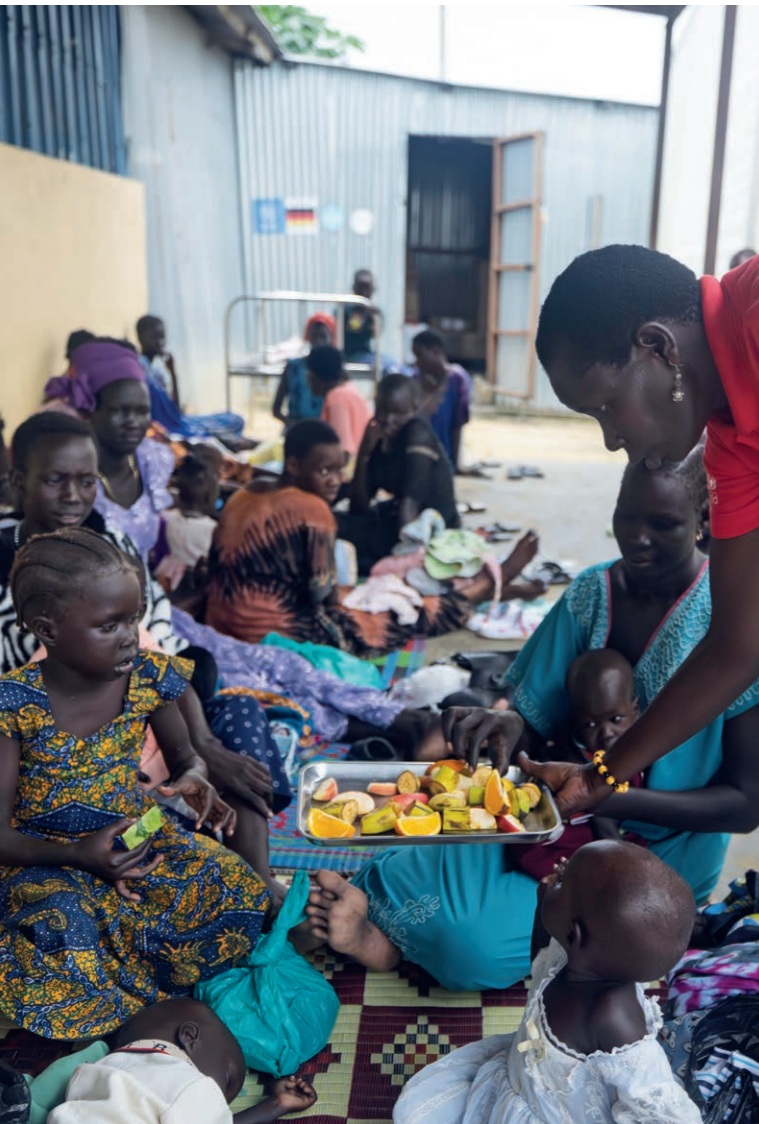
Des mères et des enfants attendent devant l'hôpital soutenu par Save the Children à Bor.