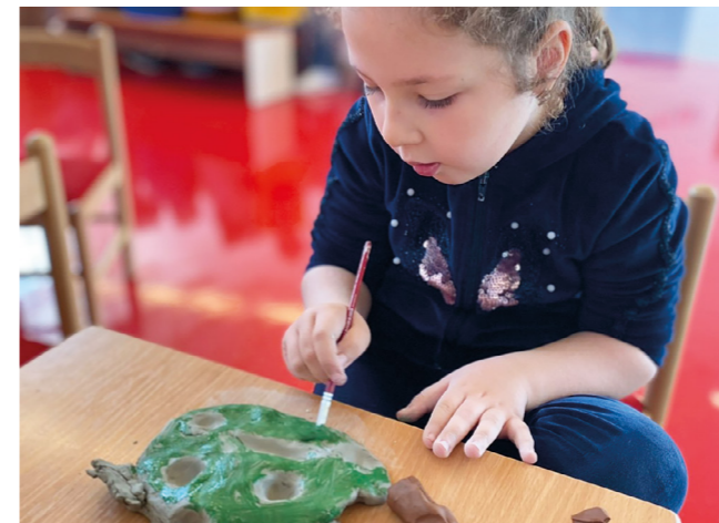
Nous donnons la possibilité aux enfants du Kosovo d'apprendre et de jouer.

Cette situation a de graves conséquences sur l'éducation et les perspectives d'avenir des enfants: seulement 7% des enfants de moins de cinq ans bénéficient des propositions éducatives. Dans les régions rurales, les établissements préscolaires sont quasi inexistantes. De nombreuses familles n'ont aucun moyen d'offrir un accès à l'éducation à leurs enfants.