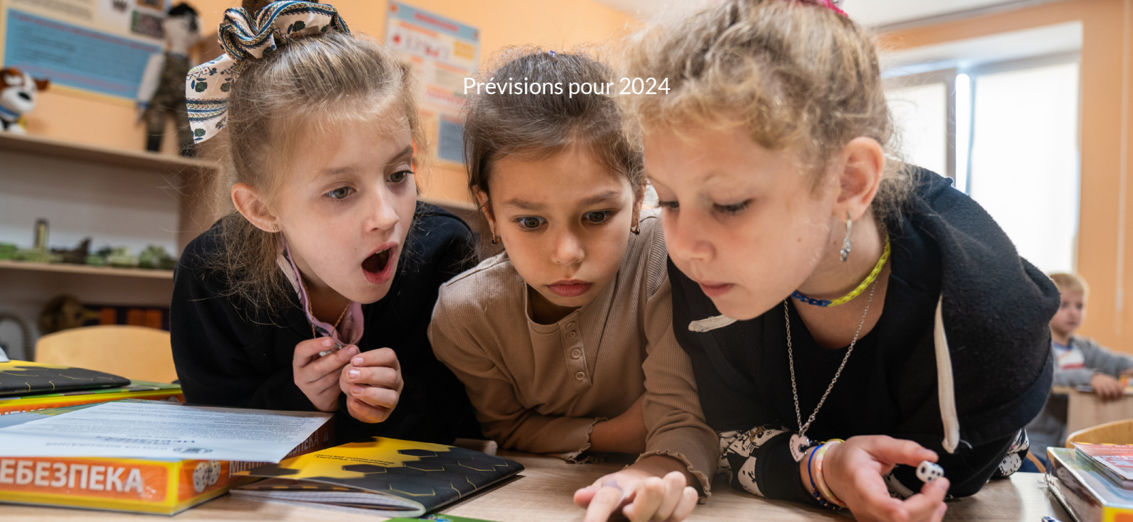
Des fillettes jouent à Mine Danger durant une session de prévention sur les mines à Kyiv Ukraine.