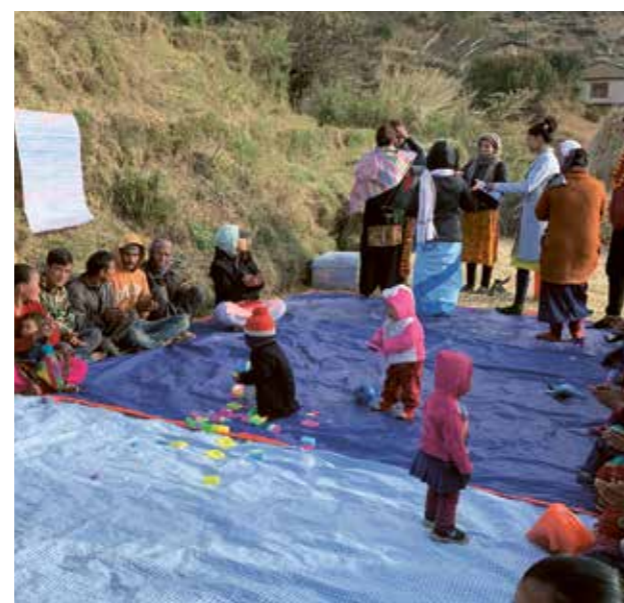
Aperçu d'une activité pour les familles dans le cadre du projet Subharambha. (image 2019)

L'objectif de ce projet éducatif mis en œuvre à Kalikot au Népal est de permettre à des tout-petits un bon départ dans la vie. Pour cela, nous expliquons à de jeunes parents les bases du développement cognitif de leur enfant et les possibilités de l'encourager. Au moyen d'émissions radiophoniques et de conseils personnalisés par téléphone, nous avons trouvé des solutions flexibles nous permettant de poursuivre notre travail même pendant la pandémie. Réaliser nos cours de cette manière offre même deux avantages : nous pouvons aider un plus grand nombre de parents qu'auparavant et diffuser en plus des informations sur la Covid-19 et les mesures de protection.