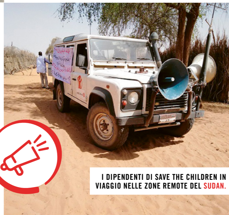
I DIPENDENTI DI SAVE THE CHILDREN IN VIAGGIO NELLE ZONE REMOTE DEL SUDAN .

Con una flotta di veicoli di Save the Children dotati di altoparlanti e cartelli molto grandi, i nostri team hanno attraversato le zone isolate diffondendo istruzioni su come lavarsi le mani e sul «social distancing», nonché informazioni sulle altre opportunità di ridurre la diffusione del coronavirus. Una compagnia teatrale locale aveva divulgato questi importanti messaggi con un'interpretazione, diffondendoli inoltre a livello locale mediante emittenti radio e altoparlanti.