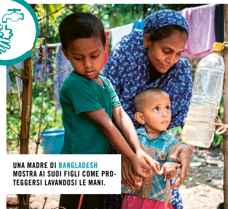
UNA MADRE DI BANGLADESH MOSTRA AI SUOI FIGLI COME PROTEGGERSI LAVANDOSI LE MANI.