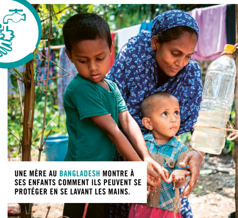
UNE MÈRE AU BANGLADESH MONTRE À SES ENFANTS COMMENT ILS PEUVENT SE PROTÉGER EN SE LAVANT LES MAINS.