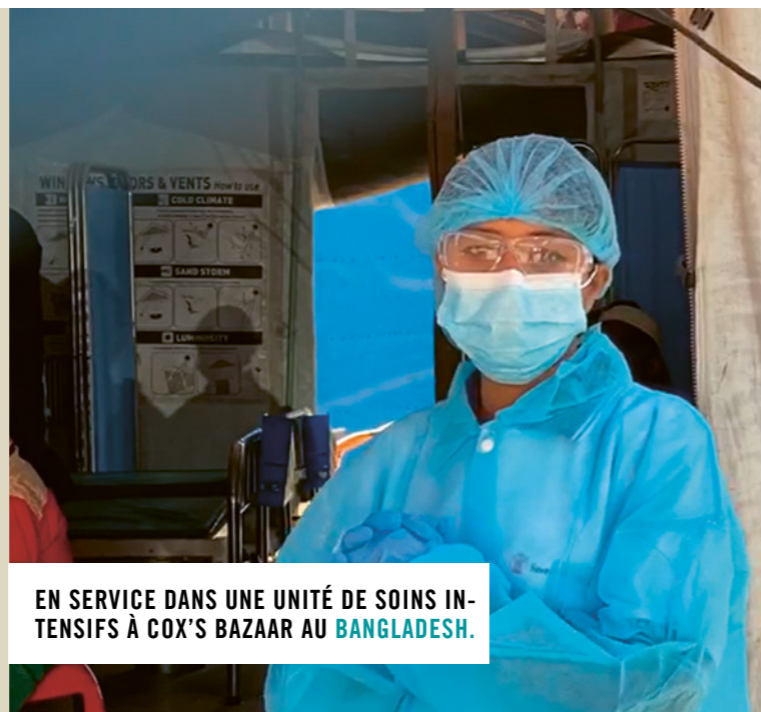
EN SERVICE DANS UNE UNITÉ DE SOINS INTENSIFS À COX'S BAZAAR AU BANGLADESH.

L'impact de la pandémie de coronavirus sur les enfants défavorisés et leurs familles dans le monde entier restera longtemps visible. Ils ont, plus que jamais, besoin de nous. Merci de les aider.