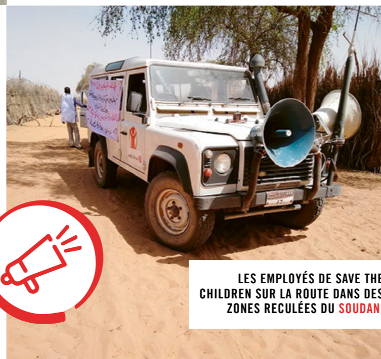
LES EMPLOYÉS DE SAVE THE CHILDREN SUR LA ROUTE DANS DES ZONES RECLÉES DU SOUDAN.

Avec une flotte de véhicules de Save the Children équipés de haut-parleurs et de grands panneaux, nos équipes se rendent dans des zones reculées et diffusent des messages concernant le lavage des mains, la « distanciation sociale » et autres moyens possibles pour éviter la propagation du coronavirus. Une troupe de théâtre local avait diffusé ces messages importants au moyen d'une animation diffusée sur les chaînes de radio locales et par haut-parleur.